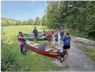
Einweisung der Teilnehmer/innen

Die Sicherheitsinfos waren natürlich super wichtig, denn wir wollten ja alle heil und munter zurückkommen!