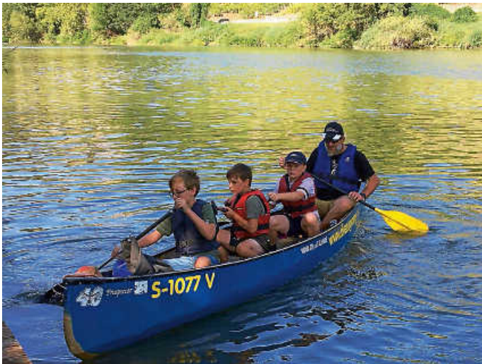
Endlich auf dem Wasser

Ein kleiner Abenteurer, der mit uns auf die Tour ging, erzählte begeistert: „Wir waren heute mit den Schwarzen Jägern Kanu fahren. Das Ganze wurde von den Zugvögeln geleitet. Als wir eingestiegen sind, war es ziemlich wackelig, aber das legte sich schnell, als wir auf dem Wasser waren. Wir mussten etwa einen Kilometer rudern, aber das ging super schnell vorbei, weil das Rudern echt viel Spaß gemacht hat!“ Und das kann ich nur bestätigen!