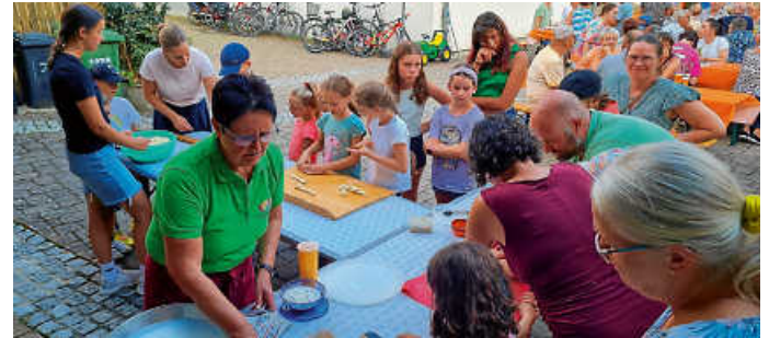
Kinder im Backeinsatz

Am 17. September kommt die mobile Saftpresse wieder zu uns auf den Bauhof. In Kooperation mit dem OGV Kleinsachsenheim können wir einen weiteren Termin am 7. Oktober für die späteren Apfelsorten anbieten. Nähere Details im nächsten Nachrichtenblatt.