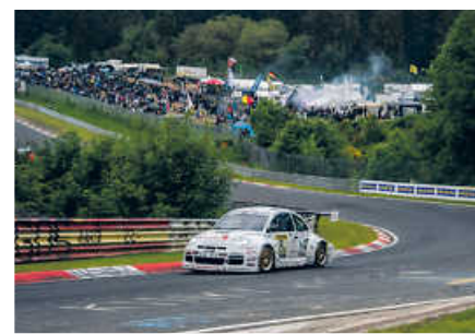
> Beetle RSR #13 in der Grünen Hölle