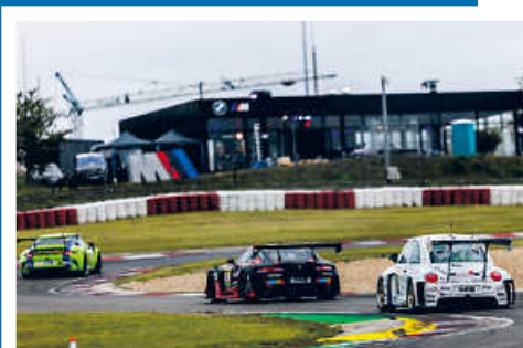
> Beetle RSR #13 in der Startphase des 24h Rennen.

Um das Projekt via PayPal direkt zu unterstützen den QR Code scannen.