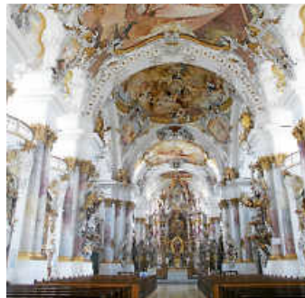
Münster Unserer Lieben Frau

Zur Gemeindefwallfahrt am Samstag, 5. Oktober 2024 zum Münster zu Unseren Lieben Frau in Zwiefalten sind alle Pfarreien der Gesamtkirchengemeinde herzlich eingeladen. Die Abfahrtszeiten sind 7.00 Uhr an der Kirche in Bönningheim und 7.10 Uhr Ecke Uhland-/Schillerstraße in Kirchheim. Rückkehr gegen 18.00 Uhr an den Abfahrtsorten. Anmeldungen sind im Pfarrbüro Bönningheim möglich. Sollten die Anmeldungen die freien Plätze übersteigen, wird eine Warteliste erstellt. Der Fahrpreis beträgt 30,00 EUR für Erwachsene und 15,00 EUR für Kinder.