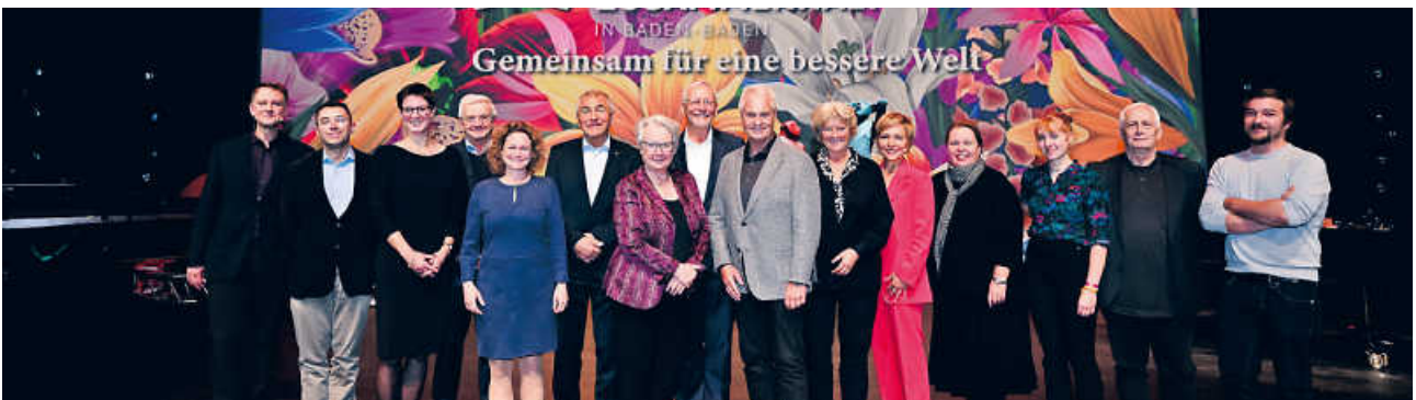
Impressionen vom Forum für Gesellschaftlichen Zusammenhalt 2022 in Baden-Baden.

Buchen Sie jetzt Ihre kostenlosen Tickets!