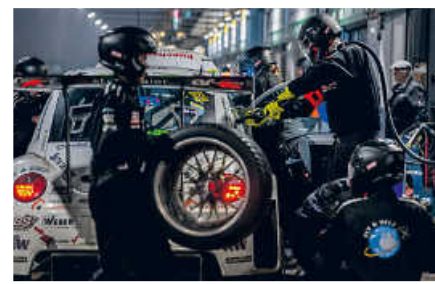
> Boxenstopp des Beetle RSR #13 in der Nacht

Jetzt über den QR-Code direkt mit dem Teamchef in Kontakt treten und das Projekt aktiv unterstützen!