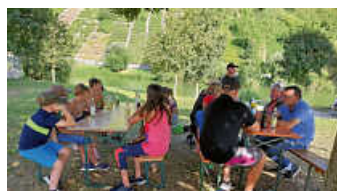
Durst und Hunger waren groß

Nach diesem aufregenden Tag gab es dann die leckeren Schwarzen Jäger-Würste und erfrischende Getränke. Der Hunger war groß und das Essen schmeckte einfach fantastisch. Die Enttäuschung über das Badeverbot war schnell vergessen und die Kinder lachten und scherzten über all die Erlebnisse, die sie hatten.