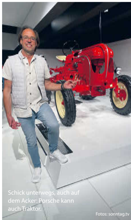
Schick unterwegs, auch auf dem Acker: Porsche kann auch Traktor.